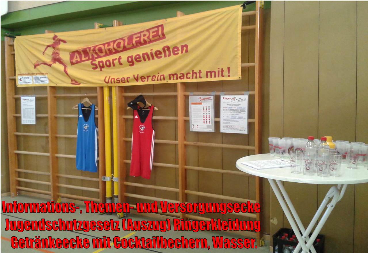
Informations-, Themen- und Versorgungsecke Jugendschutzgesetz (Auszug) Ringerkleidung Getränkecke mit Cocktailbechern, Wasser.