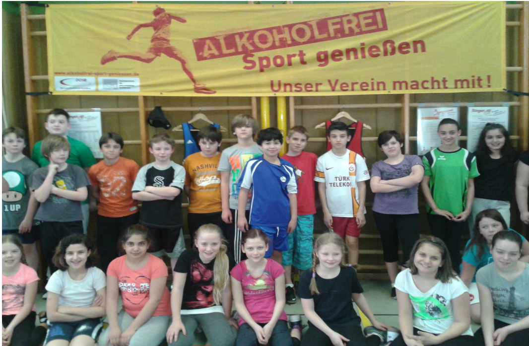
Das Bild zeigt eine der 5. Klassen am Informationsstand.